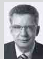
Dr. Thomas de Maizière MdB Bundesminister der Verteidigung