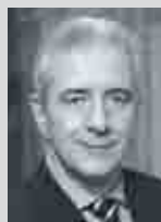
Stanislaw Tillich MdL Ministerpräsident des Freistaates Sachsen