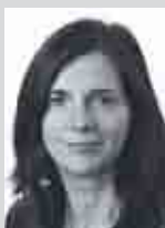
Katrin Göring-Eckardt MdB Präsidentin des 33. Deutschen Evangelischen Kirchentages

Wir freuen uns auf einen festlichen Abend mit vielen Begegnungen und Gesprächen, zu dem wir folgende Großwortredner und Ehrengäste begrüßen dürfen: