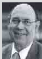
Präses Nikolaus Schneider Ratsvorsitzender der Evan- gelischen Kirche in Deutsch- land (EKD)