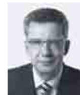
Dr. Thomas de Maizière MdB ist Bundesminister der Verteidigung

Aus Wertvorstellungen, aus der inneren Haltung den Anspruch an sich selbst zu formulieren und vor allem die Idee in die Tat umzusetzen – das bleibt die andauernde Verantwortung für jeden Christen, für jeden Bürger, für jeden Einzelnen von uns. Beginnen wir also mit der Veränderung bei uns selbst.