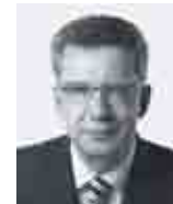
Dr. Thomas de Maizière MdB ist Bundesminister der Verteidigung

Aus Wertvorstellungen, aus der inneren Haltung den Anspruch an sich selbst zu formulieren und vor allem die Idee in die Tat umzusetzen – das bleibt die andauernde Verantwortung für jeden Christen, für jeden Bürger, für jeden Einzelnen von uns. Beginnen wir also mit der Veränderung bei uns selbst.